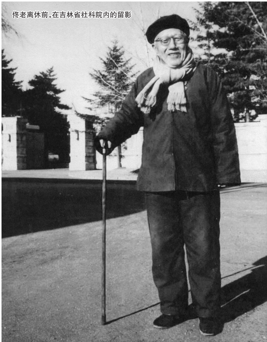
佟老离休前,在吉林省社科院内的留影