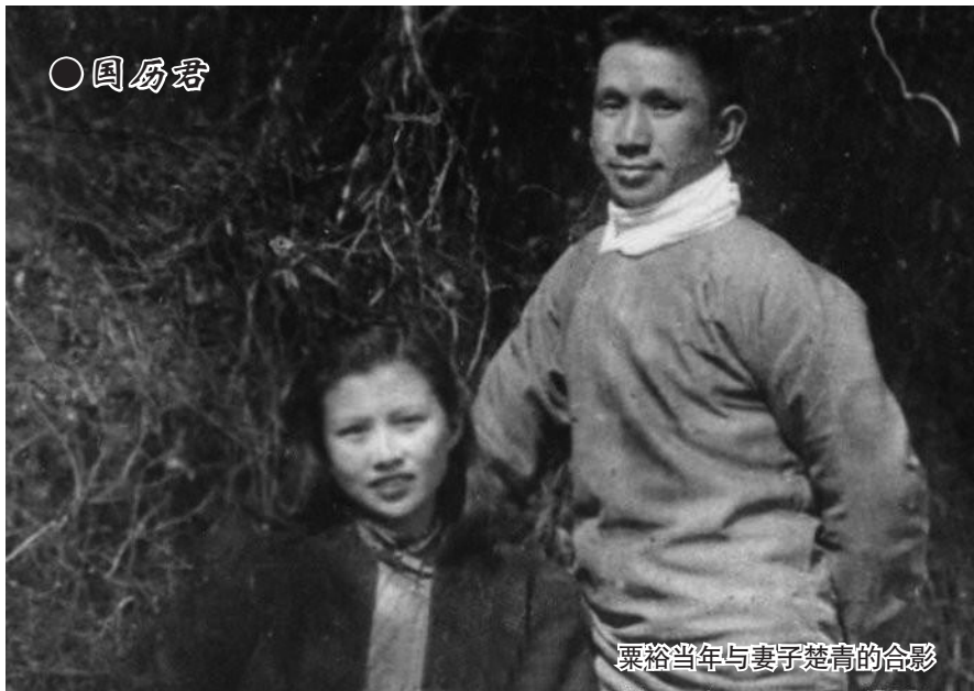
粟裕当年与妻子楚青的合影